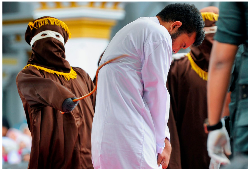
Auspeitschung eines Schwulen in Aceh

repetiert, sondern die massive Verschlechterung hinsichtlich des Minderheitenschutzes und der Meinungsfreiheit anerkennt und in Gesprächen thematisiert. Mit Hinblick auf globale Entwicklungen wäre kontraproduktiv, weiterhin die Augen vor den massiven Umbrüchen in Indonesien zu verschließen;