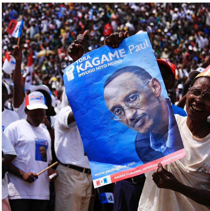
Referendum für eine Verlängerung der Amtszeit von Paul Kagame

derung angestrebt wird. Die lokale Zivilgesellschaft soll berücksichtigt und gestärkt werden und der Handlungsspielraum für NGOs, Medien und Opposition wieder stärker geöffnet werden. Die Prinzipien von Rechtsstaatlichkeit und Einhaltung von internationalen Menschenrechtskonventionen müssen einen höheren Stellenwert in der bilateralen Zusammenarbeit mit der ruandischen Regierung erhalten. ■