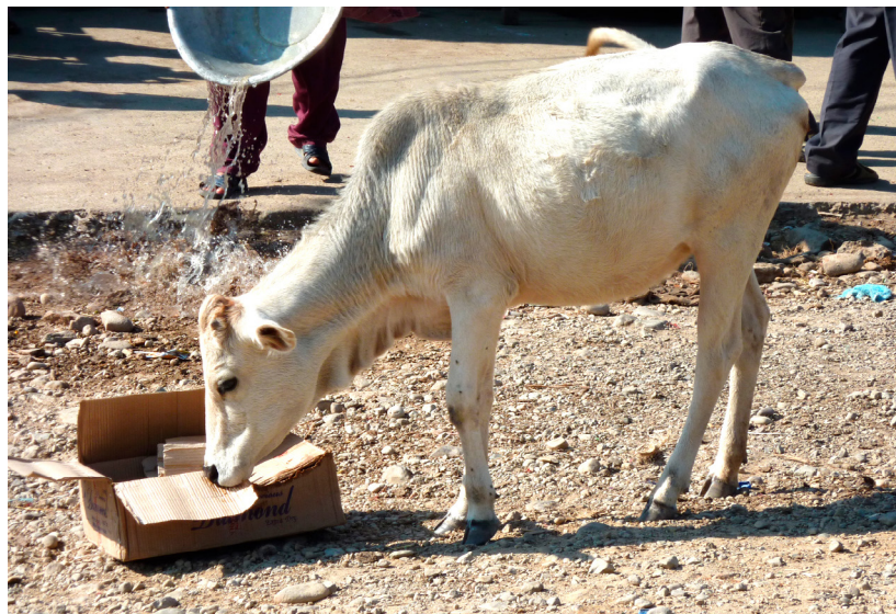
Kuh in der indischen Stadt Patna