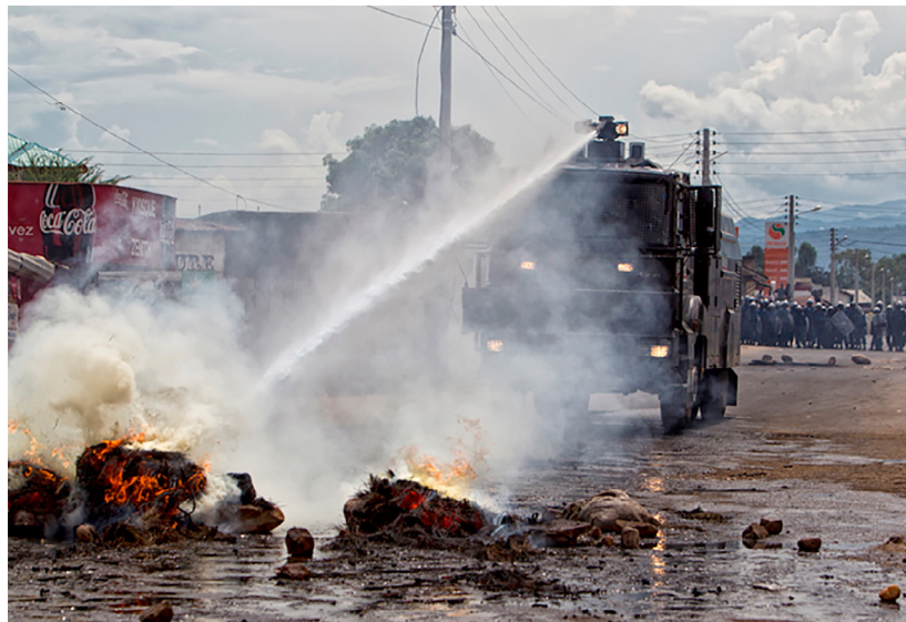
Proteste nach dem dritten Amtsantritt von Nkurunziza

matisiert und auf allen Ebenen die Forderung des unabhängigen Expertengremiums nach Aufklärung und strafrechtlicher Verfolgung unterstützt;