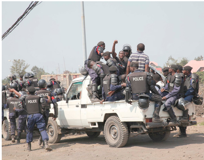
Festnahme von LUCHA-Aktivist*innen

lamentswahlen am 23.12.2018 muss von der Regierung eingehalten und die logistische, finanzielle und technische Durchführung garantiert werden. Das beinhaltet auch, dass Präsident Kabila kein verfassungswidriges drittes Mal kandidiert;