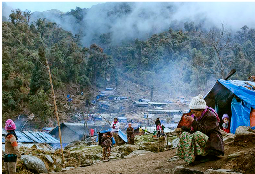
Binnenflüchtlingscamp im Kachin-Staat, Myanmar