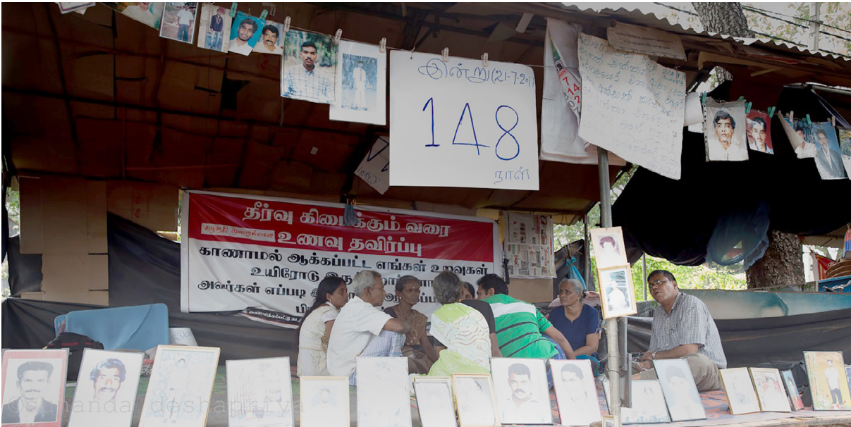
Mahnwache zur Aufarbeitung des Verschwindenlassens in Vanni (Norden Sri Lankas)

Korrespondenten gegenüber, die Regierung solle sich stärker auf die neue Verfassung konzentrieren und weniger auf die Aufarbeitung mutmaßlicher Kriegsverbrechen. Falls eine solche Untersuchung jetzt beginne, gebe es keine Verfassung.