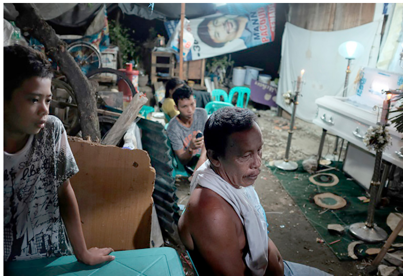
Angehörige trauern um ein Familienmitglied, das im Krieg gegen die Drogen ermordet wurde.

Ende Mai 2017 verhängte Duterte – zunächst für 60 Tage – das Kriegsrecht über die Insel Mindanao, nachdem islamistische Gruppen die Stadt Marawi City übernommen hatten. Das Kriegsrecht wurde über ganz Mindanao verhängt, obwohl die Kämpfe lokal begrenzt waren. Unter dem Kriegsrecht sind wichtige Rechte wie die Habeas-Corpus-Rechte außer Kraft gesetzt. Mehrere Klagen gegen das verhängte Kriegsrecht scheiterten vor dem Obersten Gerichtshof, der Kongress hat es bis Ende 2018 verlängert. Wiederholt hat Duterte gedroht, das Kriegsrecht auf die ganzen Philippinen ausdehnen zu wollen. Dabei nannte er Ex-Diktator Ferdinand Marcos als Vorbild. Marcos hatte im September 1972 das Kriegsrecht ausgerufen, um den kommunistischen Aufstand effektiver bekämpfen zu können. In der Folge hatte er die neue Machtfülle genutzt, um politi-