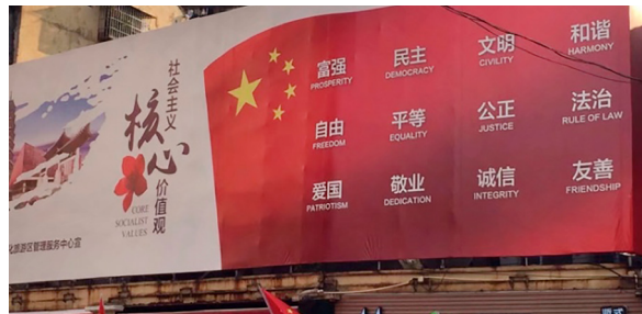
Chinesischer Sozialismus: Demokratie, Rechtsstaatlichkeit und Freiheit sind chinesische Werte

Laut chinesischen Medien sammelt die Regionalregierung in Xinjiang seit Dezember 2017 aufgrund von »Gesundheitsmaßnahmen« Fingerabdrücke, Augen-scans und Blutproben der Bevölkerung zwischen 12 und 65 Jahren. Das 2017 neu eingeführte »Sozialkreditsystem für Chinas Bürger*innen« hat zwei Gesichter: Es hält Unternehmen an, pünktlich den Lohn auszuzahlen und bestraft sie mit einer Herabstufung im Rating bei Missachtung der Vorschriften. Gleichzeitig dient es dazu, die soziale Kontrolle jedes Einzelnen durch Melde- und Bespitzelungsbelohnung über ein digitales Punktekonto anzustacheln. Ein Klima der Angst ist entstanden. Willkür und ethnische Diskriminierung nehmen zu. Laut