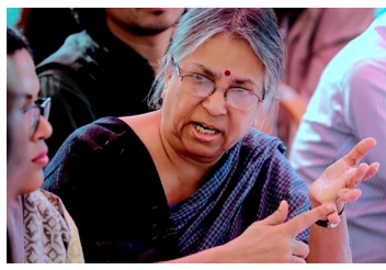
Sultana Kamal

Die genannten Konflikte und eine mögliche Zunahme politisch motivierter Gewalt im Vorfeld und während der Parlamentswahlen im Dezember 2018, von der insbesondere Frauen, religiöse Minderheiten und indigene Gruppen bei vorherigen Wahlen betroffen waren, drohen Bestrebungen der internationalen Entwicklungszusammenarbeit entgegenzuwirken. Eine weitergehende Analyse, die die gegenwärtige Gewalt in Bangladesch und deren Ursachen beleuchtet, ist unerlässlich. Dabei ist es von zentraler Bedeutung, auch die Auswirkungen der internationalen Wirtschafts- und Investitionspolitik auf die demokratischen Strukturen zu untersuchen. Zudem ist zu reflektieren, inwieweit die von Gewalt geprägte politische Kultur der beiden großen Volksparteien zu einer Erhöhung der gesellschaftlichen Gewaltbereitschaft sowie der Etablierung gewaltbereiter Bewegungen beigetragen