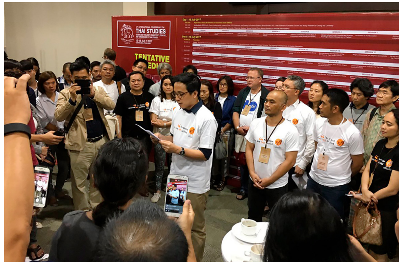
Teilnehmer*innen einer internationalen Konferenz in Chiang Mai verlesen eine gemeinsame Stellungnahme zur Freiheit der Wissenschaften und zur Meinungsfreiheit.

fen, in denen über Grundrechte gesprochen werden kann, so wie beim Jahrestag der Menschenrechte 2014 an der Universität Khonkaen;