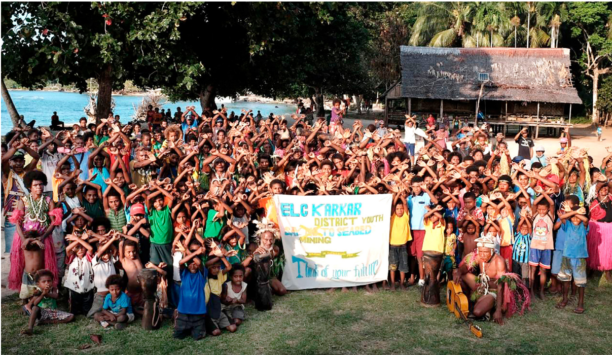
Gemeinde auf Bagabag Island, PNG, stellt sich gegen Tiefseebergbau

durchgeführte Umweltverträglichkeitsprüfung von zivilgesellschaftlichen Organisationen als fehlerhaft kritisiert. Indigene Gemeinschaften weisen auf die mangelnde Beteiligung der Betroffenen hin und betonen, dass sie dem Projekt nicht zugestimmt hätten und dass nicht alle relevanten Informationen zugänglich seien. Dies widerspricht internationalen Menschenrechtsstandards, die verlangen, dass indigene Völker ihre »freie, vorherige und informierte Zustimmung« (»free, prior and informed consent« – FPIC) zu sie betreffenden Projekten und grundlegenden Entscheidungen erteilen müssen. Infolgedessen hat sich eine breite Front von Fischern, Anwohnenden, NGOs und kirchlichen Institutionen formiert, die den Tiefseebergbau in Papua-Neuguinea ablehnen. Sie versuchen, durch friedliche Proteste, Unterschriftenaktionen und Kampagnen den Beginn einer industriellen Förderung von mineralischen Rohstoffen vor ihrer Küste zu verhindern.