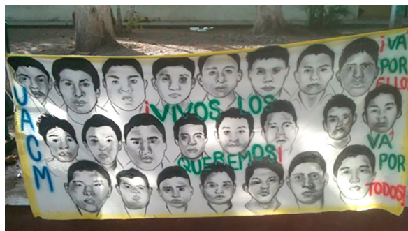
Plakat der 43 verschwundenen Studenten von Ayotzinapa, Guerrero, Mexiko

Ende des Jahres 2017 verabschiedete der mexikanische Kongress entgegen verfassungs- und menschenrechtlichen Bedenken zahlreicher nationaler und internationaler Akteure ein Sicherheitsgesetz, das den Einsatz des Militärs im Landesinnern legitimiert und auswei-