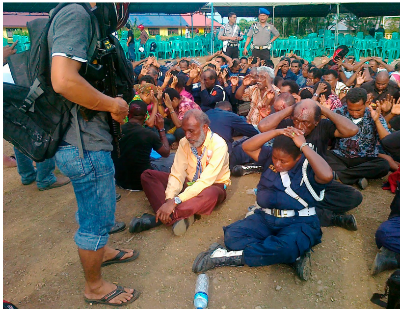
Indonesische Polizei nimmt indigene Papuas bei politischer Veranstaltung fest