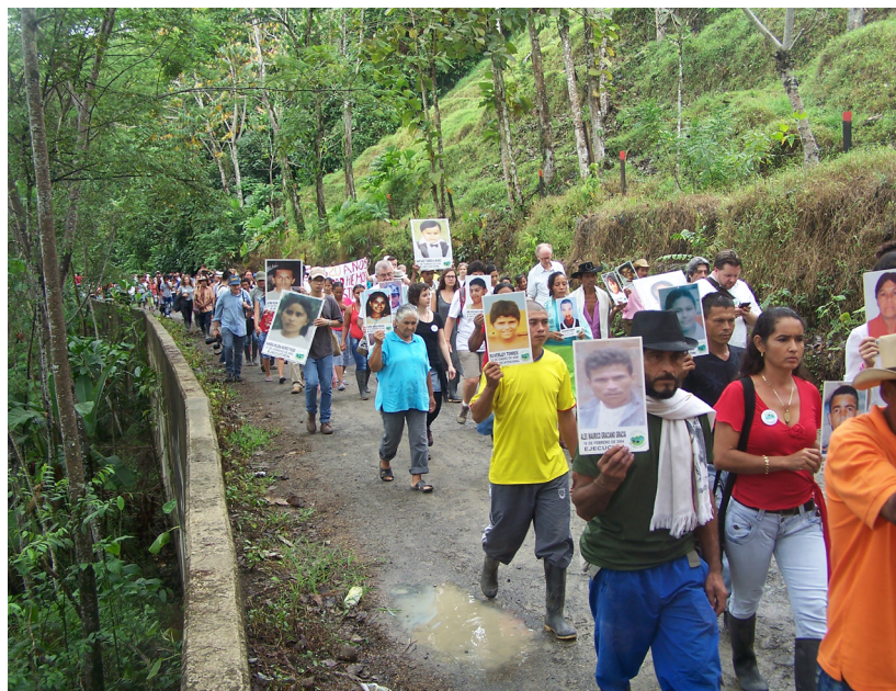
Erinnern an die Opfer – Protest gegen Straflosigkeit in der Friedensgemeinde von San José de Apartadó

In den letzten Jahren gab es bei sozialen Protesten viele Verletzte und Tote, insbesondere waren Kleinbäuer*innen, Indigene und Afrokolumbianer*innen betroffen. Dies ist darauf zurückzuführen, dass Sicherheitskräfte Schusswaffen sowie Tränengas- und andere an sich nichttödliche Geschosse aus nächster Nähe gegen Protestierende einsetzen. Regierungsvertreter*innen sprechen sozialen Protesten vielfach öffentlich die Legitimität ab. Das »Gesetz für Sicherheit der Bürger« aus dem Jahr 2011 definiert das Blockieren von Straßen als Straftatbestand, was zu einer massiven Kriminalisierung von Protestierenden führt.